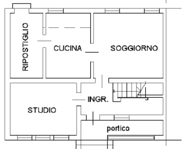
piano terra h=2.90 m