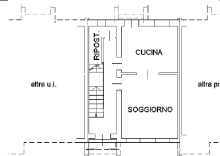
piano terra h=2.75 m